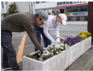
協議員による花壇の手入れ