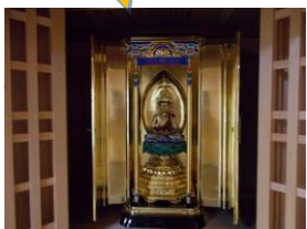
鈴の森神社(本尊) 大日如来像