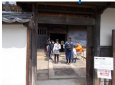
② 大庄屋 三木家