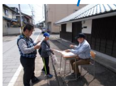
③ 元鈴の露酒造、元ますや旅館