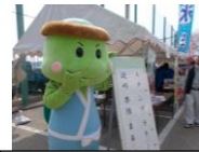
スタンプラリー受付