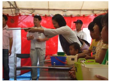
楽しかった民俗学のタベ

一年目は、辻川区を通る「銀の馬車道」の舗装美化(カラー舗装)が実施されました。二年目は、改修工事中の三木家住宅の仮囲いのラッピングと、記念館・歴史民俗資料館周辺の美装舗装とバリアフリー化が実施されました。そして三年目の今年度は、短歌の森の整備、鈴の森神社から北野天満神社までの「学問の道」整備、山頂展望台看板設置、遊歩道案内標識を設置するなどの辻川山の整備と、一隣保内にポケットパークの整備等が計画され、来年3月までに完成の予定です。