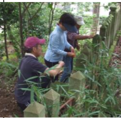
7月14日 玉垣破損状況再調査

この度の事業は、地元辻川区にとっては大変喜ばしい事であり、是非地域の活性化に繋げていきたいと考えます。今後は、辻川山周辺の活用と山の手入れに皆さまのご協力をお願いしたいと思っています。