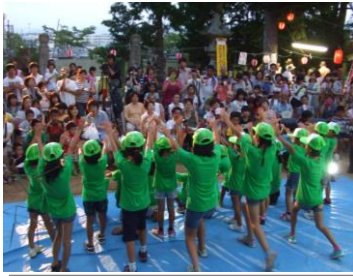
↑「もちむぎマーチ」ダンス(山田文庫)