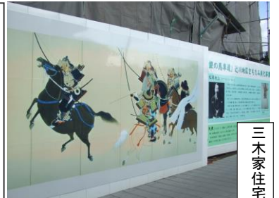
三木家住宅に屏風絵

「三木家住宅に屏風絵」 三代交流 平成二五年度の辻川区の事業として「三世交流グランドゴルフ大会」を計画しました。これは、以前から住民の方々の要望でもあり、それにもまして、子どもと高齢者の交流を意図的につくり出す必要性を感じていたのであります。子どもと高齢者の世代を超えた交流は、かつては、家族や地域の日常生活の中にふつうに存在するものでした。地域社会では大人は子どもたちを見守り、他人の子どもでも悪いことをした時には叱るということが、ごく自然に行われていました。そのような社会が最近では、少子高齢化や核家族化が進んだこともあり、急速に変化してきました。 そこで、異世代が共存していくことの大切さを見直すきっかけになればとの思いもあって、あえて「三世交流」という名称を使ったわけです。地域の住民が交流することによって「コミュニケーション」がはかられ、地域の子もたちがすこやかに育ち、心のかよいあう地域づくりが出来るものと考えます。この機会に是非参加して、一日楽しく過ごしていただきたいと思います。