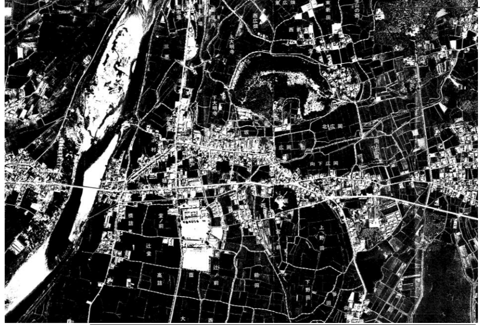
図1 国土地理院 昭和40(1965)年2月 撮影 [ほぼ図2と同じ範囲]

〔昭和三一年〜五〇年頃〕 「今このカケアガリ(現田尻の交番付近)を西にまっすく市川に架かる神崎橋に向かって舗装道路が新設されている…」との記録(昭和二四年三月)に登場する県道三木―山崎線(現田尻辻川線)の開通によって辻川の風景は大きく変化する。旧来の「東所」「中所」「西所」に「新開地」が加わったのである。