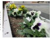
公民館前のパンジー