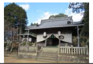
正月の鈴の森神社