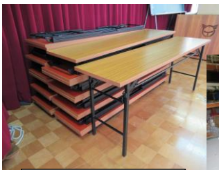
新規購入したテーブル (公民館 2F ステージ)