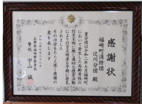
消防の詰め所に飾られています

けがも体調不良もなく、事なきを得た。 暗い話題が多い中で、明るいニュースでした。