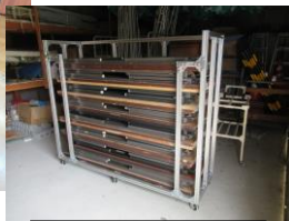
防災倉庫に収納した古いテーブル