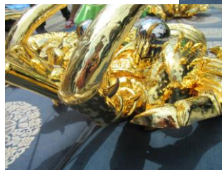
ひび割れている(飛龍)