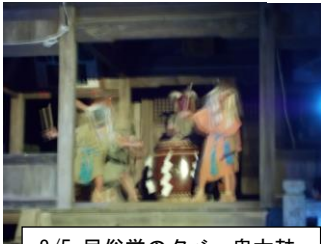
8/5 民俗学の夕べ 鬼太鼓