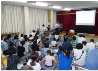
7/21 人権学習・青少年健全育成研修