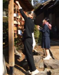
昨年の 第1回は 町教委の 松岡家五 兄弟石像

昨年に引き続き、町の提案を受けて辻川区主催で実施(町行政は宗教的行事には関われないため)。当日は辻川から六名、区外から五名の受験生が参加し、本殿でご祈祷と絵馬奉納の後、「学問成就の道」を巡り志望校合格を祈った。辻川では従来(14年前)から中学PTAが3年生の合格祈願を「冬えびす」に併せて行っていたが、今回から観光協会が広く一般公募し(広報ふくさき12月号参照)、日程は「冬えびす」に併せることになった。