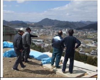
辻川山山頂の望郷の丘(工事中)