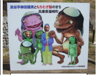
3/8 河童の顔出しパネル