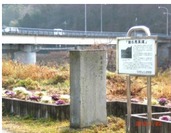
「馬車道修築」記念碑… 姫路市砥礪の生野橋の西詰に建つ。旧街道を利用した工事だったので「修築」となっている。現在の生野橋は三代目。馬車道が飾磨津(港)から北上し、生野へつながる拠点にある橋ということで「生野橋」と名づけられたのだろうか。

た通称「銀の馬車道」は明治九年に完成する。道幅が5m以上あったため三木家も敷地を北へ引き、表門や土塀を作り替えた。図2の田原村西田原小字絵図(明治六年 井ノ口地区蔵)には馬車道がはっきりと描かれている。この絵図からは今の角屋さんから井ノ口へ新たな道が整備中であることがわかる。この道は現在国道312号線となっている。明治時代の里道や水路がその後どのように変遷したか、調べてみるのも面白い。