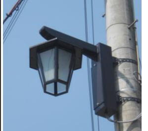
新設された大正時代風の街灯

また暑い夏がやってきました。辻川区では、山桃忌を前にした一週間を民俗学週間として恒例行事を行ってきました。今年も辻川界隈展と民俗学の夕べの準備をしています。