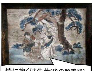
懐に抱くは牛若(後の源義経)

鈴の森神社の絵馬「常盤御前」(天保十年「1836年」)が、5/19(土)から5/24(水)の市室津海駅前企業画展「絵馬に描かれた源平」に貸し出された。