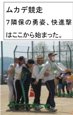
ムカデ競走 7隣保の勇姿、快進撃 はここから始まった。

隔年開催の辻川区最大のイベント。前日に引き続きの夏日の一日、住民の約半数の500名余りが一堂に会し、辻川山の新緑の中、『見上げてごらんあの星を』そして『虹を』をキャッチフレーズに、三十八年目の運動会を楽しんだ。