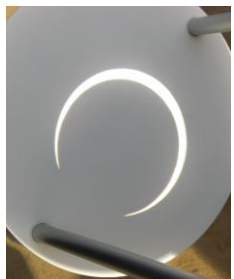
5/21(月)7:30 金環日食にあとわずかの投影板上の部分日食(姫路で)

サラリーマン川柳ベスト10(4/27朝刊)から… 「立ち上がり 目的忘れ また座る」 「最近忘れぬよりも 覚えぬ」 身に覚えのある句に思わず納得。 ところで「金環日食」は見られましたか。木漏れ日に見る日食も幻想的でした。