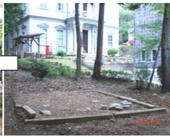
5月3日 周辺木々の伐採始まる