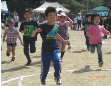
第25回運動会 菓子とり急げ

発行 辻川区 [辻川公民館] 〒679-2204 福崎町西田原 1227 TEL 0790-22-5763 ホームページ http://www10.plala.or.jp/tujukawa/