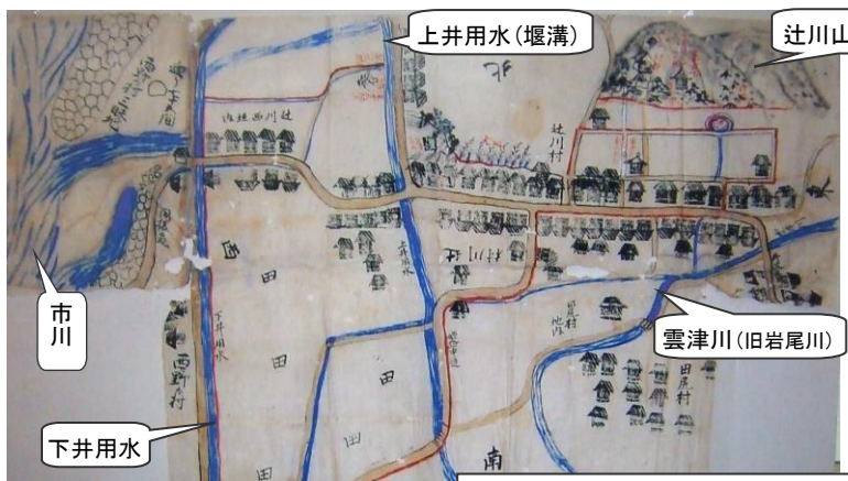
図1 明治4(1871)年 辻川村絵図

明治前期の道を見る前にその時代背景を整理しておこう。江戸時代を通じて福崎町域の村々はすべて姫路藩領であり、姫路藩辻川組の大庄屋を勤めたのが三木家であった。その姫路藩も明治維新後は版籍奉還の建白書を太政官に提出し、明治四年に廃止され姫路県が設けられた。その後、姫路県から飾磨県を経て、明治九年にこの地は兵庫県に統合された。政治や社会の変動は明治四年に播磨一揆を生み、三木家も襲撃を受けた(表座敷「かみの間」の縁側に当時の刀傷といわれている傷跡などが残る)。また、明治新政府は神道を国