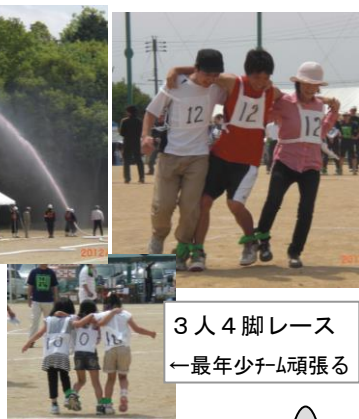
3人4脚レース ←最年少チーム頑張る

優勝の7隣保(74点)は昼の焼肉が功を奏したか…。住民の皆様、お疲れ様。そして体育委員はじめご協力いただいた皆様感謝。 準優勝 12隣保(67点) 第3位 3隣保(59点)