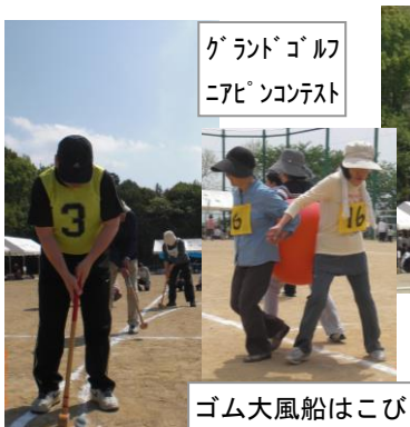
グランドゴルフ ニアピンコンテスト