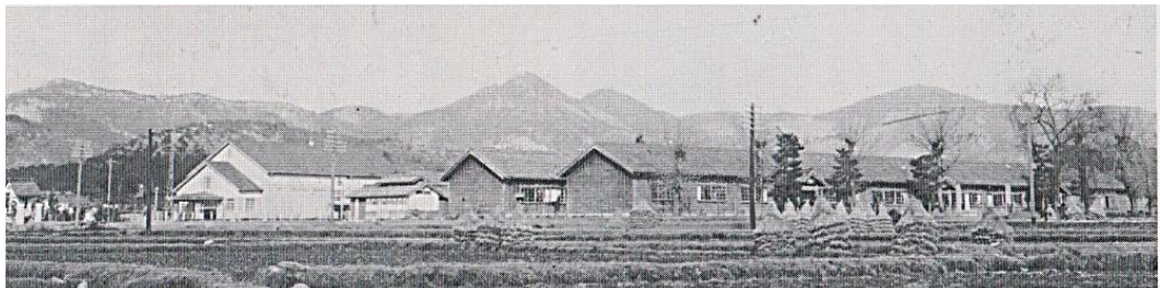
新講堂輝く昭和12年(校歌が出来た頃)の田原尋常高等小学校 講堂後方は辻川山、後方中央はカラタチ山、右方は日光寺山(山の木は少ない)