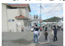
4ブロックの訓練の様子

また、現在、辻川区の消火栓のフタは、新旧合わせて4種類あります。自宅の近くの消火栓のフタが、訓練場所のフタと異なる可能性があります。いざという時のために一度確認しておかれることが肝腎です。