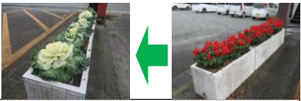
11月にサルビアから葉牡丹に(公民館前花壇)

さて、区民の皆さんの地域への愛着及び交流ふれあいを深め、更に新しい発見の為に、今回「保存版・ぶらり辻川界隈ガイドブック」を作成しました。皆さんと一緒にまち歩きを十月末に予定しておりますが、来春三月頃に延期いたします。ガイドブックは十二月の初めに各戸に配布いたしますのでご家庭で一度目を通していただき来春のまち歩きまで大切に保管してください。まち歩き当日にはガイドブック片手に多くの方の参加をお願い申し上げます。最後に、少し早いですが、来年の干支は「寅」です。寅年は成長していく年、象徴が生まれる年と言われています。輝かしい新年が、迎えられるよう祈念いたします。