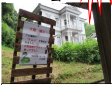
山口堂横の注意の看板